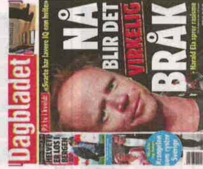
Dagbladet 12. april.